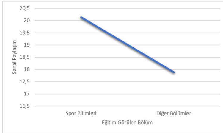
Şekil 3: Sporcuların Eğitim Gördükleri Bölüm Değişkenlerine Göre Sanal Ortam Yalnızlık Ölçek Toplam Puan Grafiği

Tablo 5'de öğrencilerin eğitim gördükleri bölüm değişkenine göre Sanal paylaşım alt boyutunda spor bilimleri öğrencilerinin ortalamalarının diğer bölümlerde okuyan öğrencilerden yüksek olduğu; Sanal sosyalleşme ve Sanal Yalnızlık alt boyutları ile ölçek toplamında ise anlamlı bir farklılığın olmadığı görülmektedir.